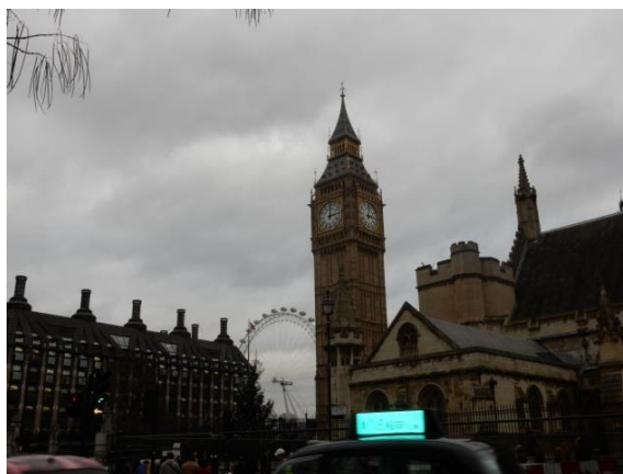
Big Ben, London Eye