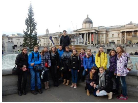
Trafalgarské náměstí, Národní galerie