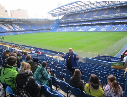
stadion FC Chelsea