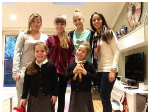
ubytování v hostitelské rodině