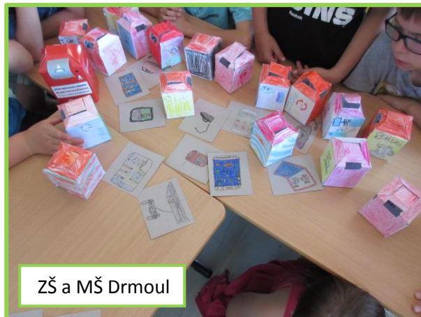
ZŠ a MŠ Drmoul