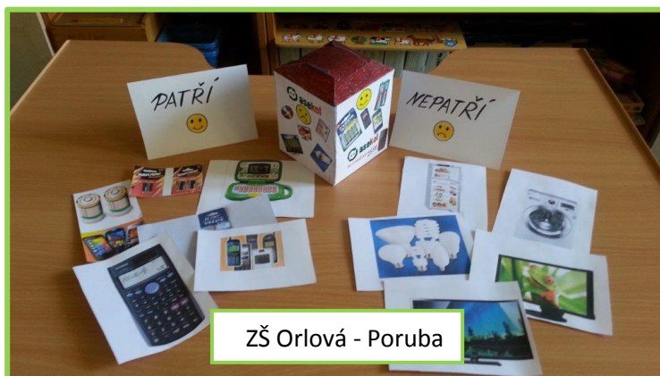
ZŠ Orlová - Poruba